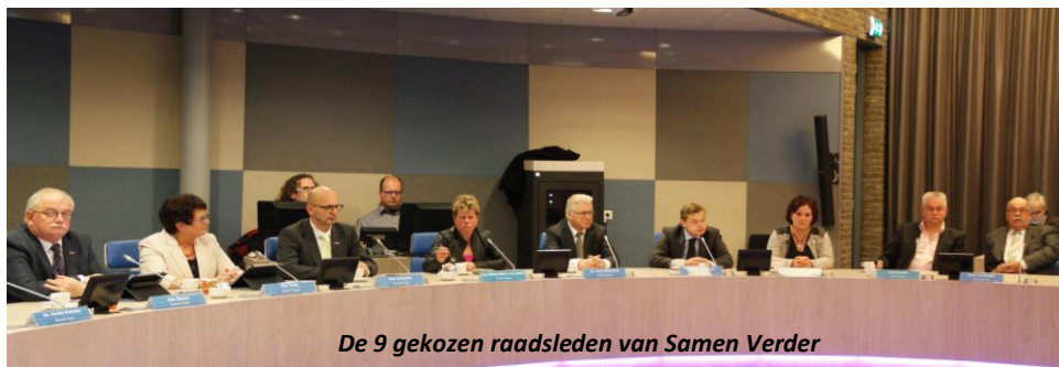
De 9 gekozen raadsleden van Samen Verder

Na alles uit de kast gehaald te hebben op promotiegebied en vooral het laatste jaar besturen van de gemeente - nadat de vorige coalitie was ontploft - hebben we ruim de steun van de kiezers in Leudal gekregen en een eclatante overwinning behaald.